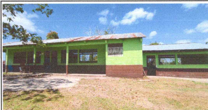
Foto 1: Se observa el deterioro de las láminas. Se cambiará el techo por la mala instalación, la cual provoca filtración de agua en tiempo de invierno.