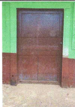
Foto 2: Se observa el deterioro de la puerta de madera por lo que es necesario sustituirla por una de metal.