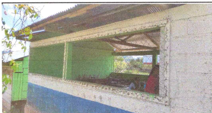
Foto 6: Se observa el deterioro de la malla y por consecuencia el aula está insegura y/o vulnerable.

Observación: Si es necesario se pueden agregar hojas adicionales y actualizar el número de hojas.