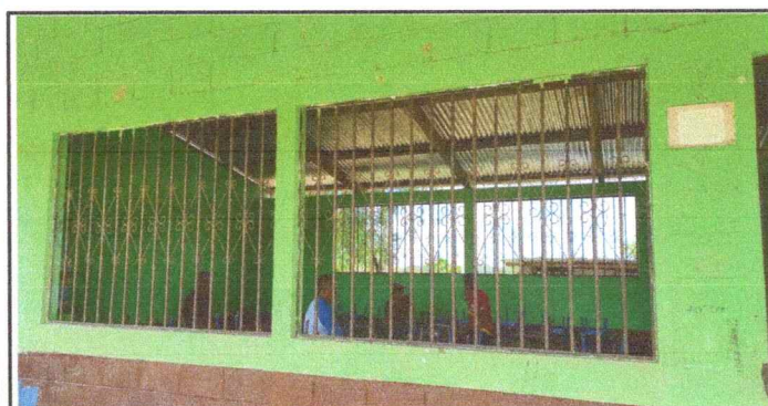
Foto 5: Se observa el deterioro de los balcones frontales del aula.